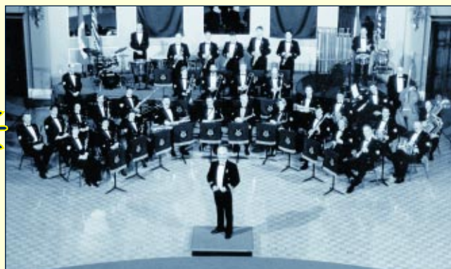
Naden Band of Maritime Forces Pacific